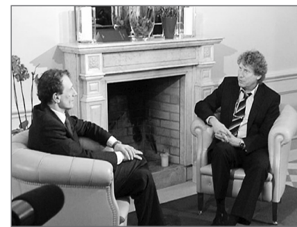
Die Studie fand breite Resonanz in Funk-, Fernsehen- und Printmedien

Aufbauend auf dieser Studie evaluiert das FZG in einem weiteren aktuellen Forschungsprojekt gemeinsam mit der polnischen Nationalbank die fiskalischen Nachhaltigkeitswirkungen der vergangenen Rentenreformen. Dabei kann sich die Bilanz der polnischen Rentenpolitik durchaus sehen lassen: trotz des rasanten Alterungsprozesses müssen die Rentenbeitragssätze in den kommenden Jahrzehnten voraussichtlich kaum erhöht werden. Die künftige Herausforderung in der polnischen Altersvorsorge besteht daher weniger im Bereich der fiskalischen Tragfähigkeit, sondern vielmehr im Schließen der individuellen Rentenlücken. Gerade an jüngere Kohorten sei daher appelliert: Mind the pension gap! ■ cm